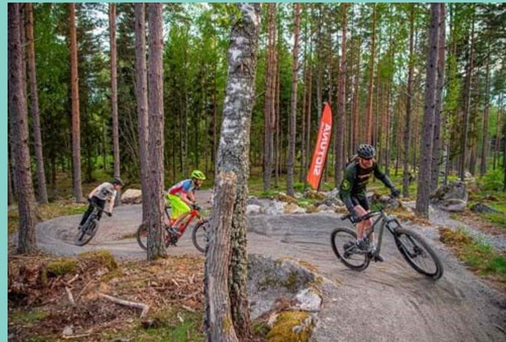
Cykling i Hällsboskogen.

Hällsboskogen är en viktig rekreativ miljö som skapar möjligheter till både lek, idrott och friluftsliv. Av studien framgår att den cykelverksamhet som bedrivs där bidrar till att tillgängliggöra miljön för de minsta. Cykelbanorna erbjuder små barn ett planare underlag att röra sig på, vilket underlättar deras vistelse i skogen. Eftersom barnen gillar att leka och springa ikapp på banorna fungerar de också en målpunkt för förskolans utflykter, vilket ökar barnens motivation att ta sig ut i naturen.