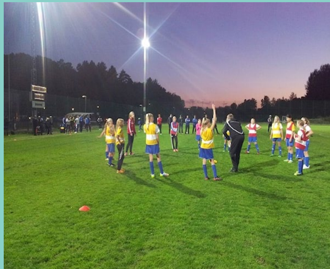
Fotboll vid Prästängarna.

De barn och unga som intervjuats uppger också att utbudet av lekplatser i Hällsbo, Sigtuna Stadsängar och omgivande bostadsområden (Brännbo, Pilsbo mf) är väldigt sparsmakat. De få lekplatser som finns är dessutom slitna och främst utformade för småbarnslek. Med undantag för Gamla Sigtuna stad menar man också att det finns en brist på parker i närmiljön.