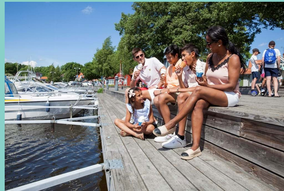
Hamnen i Sigtuna stad.