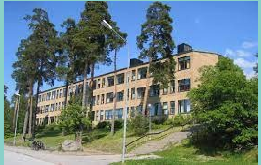
St Olofs skola.

Det verkar med andra ord finnas etablerade och delvis stigmatiserande bilder av olika områden och skolor som tydligt relaterar till samhällsklass och social status. Sigtuna Stadsängar framstår däremot som ett nytt område som man än så länge inte har någon tydlig bild av.