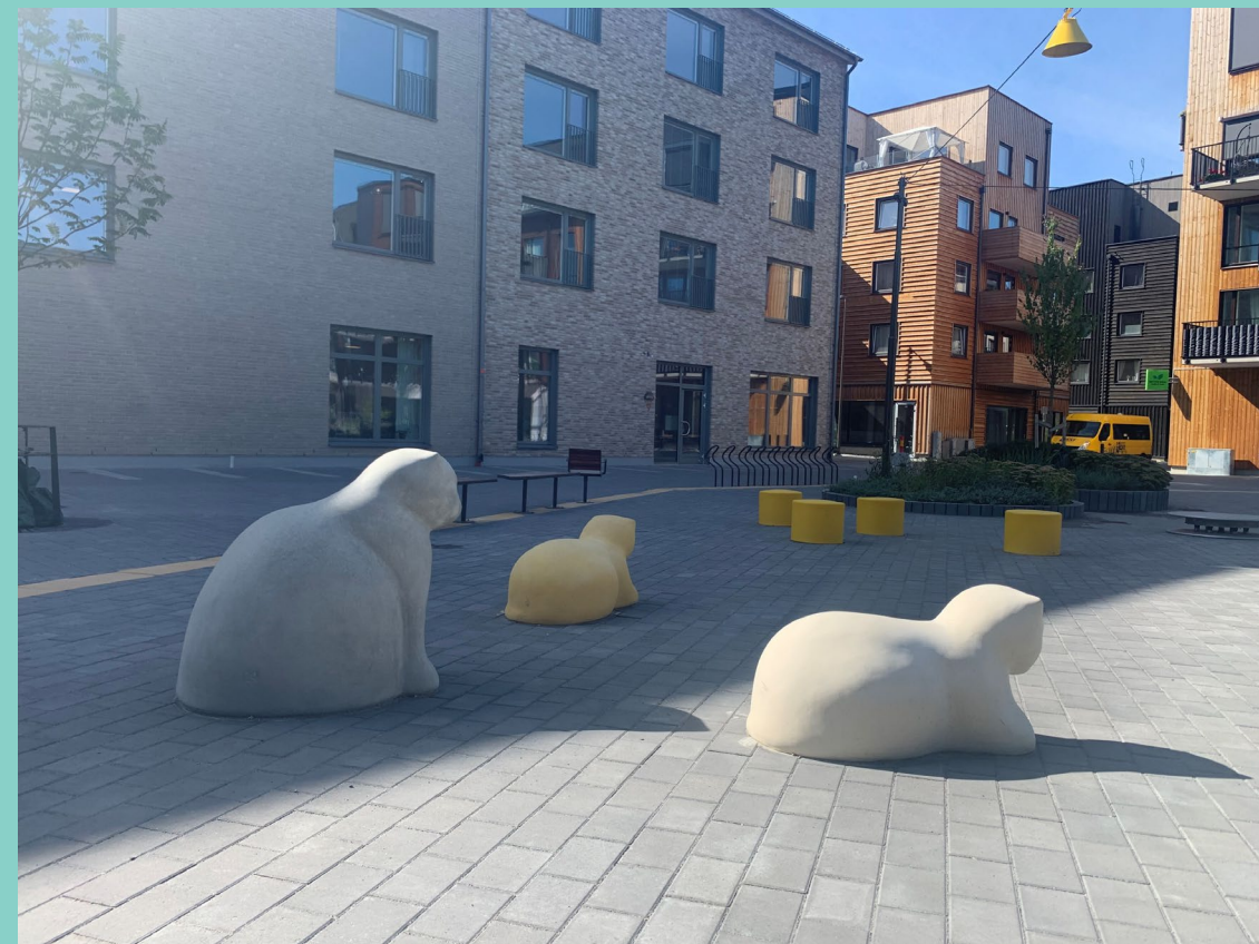
Silvertorget i Sigtuna Stadsängar

Vid platsbesök i Sigtuna Stadsängar framgick även att det lokala centrumet saknar attraktiva vistelseytor i form av torg eller parker med trevliga sittplatser för umgänge i grupp.