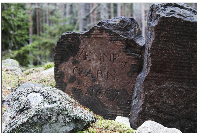
Fig 3-4. Inskrifterna på gränsmärket L2015:2656.