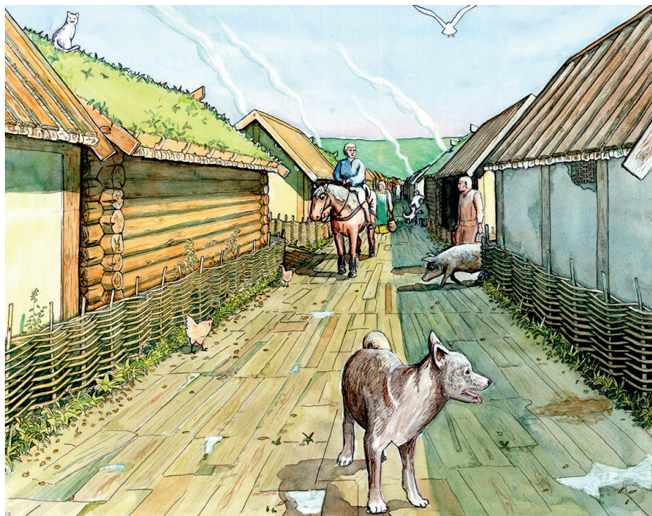
Illustration: Jacques Vincent ur boken Vyer från medeltidens Sigtuna .

VISNING AV SIGTUNAHISTORIER: 1. FOKUS PÅ SIGTUNA SOM STAD samt 2. SIGTUNA - STADEN DÄR VIKINGATIDEN TOG SLUT Programmen är kopplade till målen i samhällskunskap och historia.