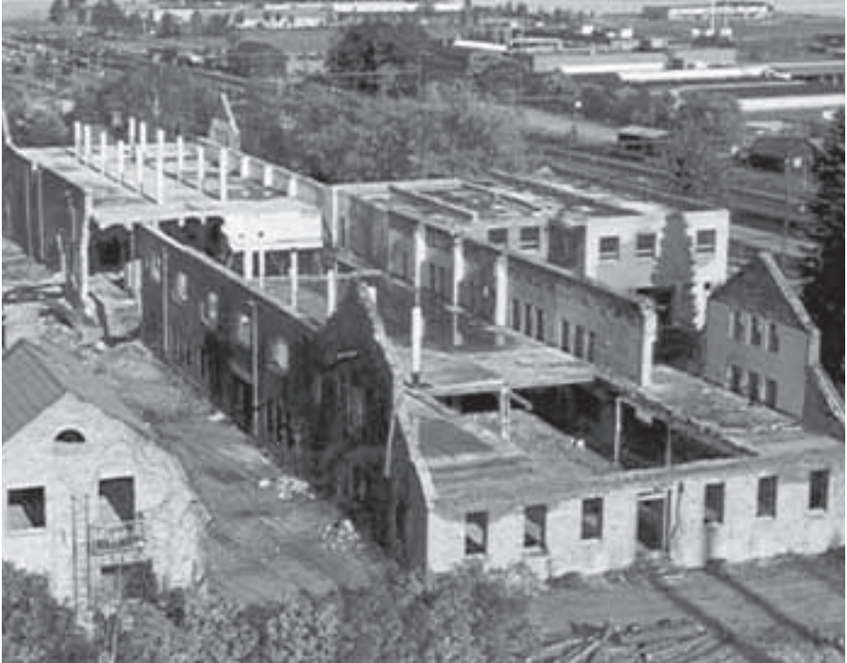
Sigtuna kommunhus i Märsta 1984.