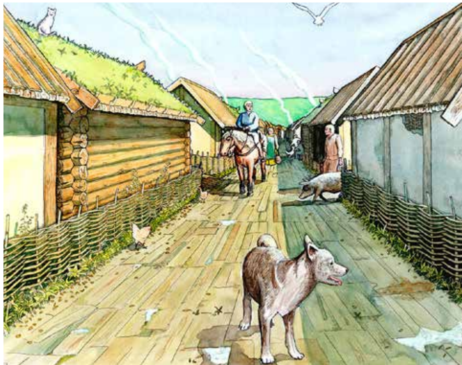
Illustration: Jacques Vincent ur boken Vyer från medeltidens Sigtuna .

VISNING AV SIGTUNAHISTORIER: 1. FOKUS PÅ SIGTUNA SOM STAD samt 2. SIGTUNA - STADEN DÄR VIKINGATIDEN TOG SLUT Programmen är kopplade till målen i samhällskunskap och historia.