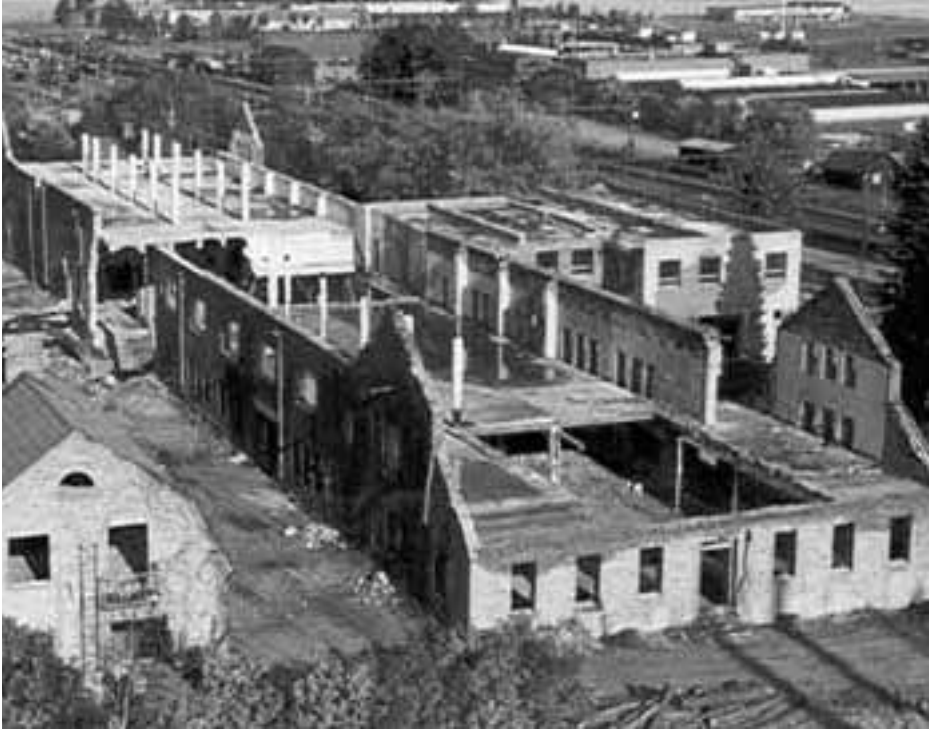
Sigtuna kommunhus i Märsta 1984.