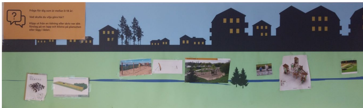
Affisch med barn/ungdomsfråga, vad vill du göra här?

8 stycken barn deltog. Det som klistrades upp var från vänster: labyrint, liten balans- och motorikbana, en lekplats i trä, en linbana i trä, en lekplats med huvudsak klättring, en lekfontän, en klätterborg i trä och studsmattor med omgivande gummimatta.