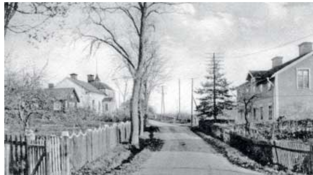
Salem med sitt nya torn år 1911.