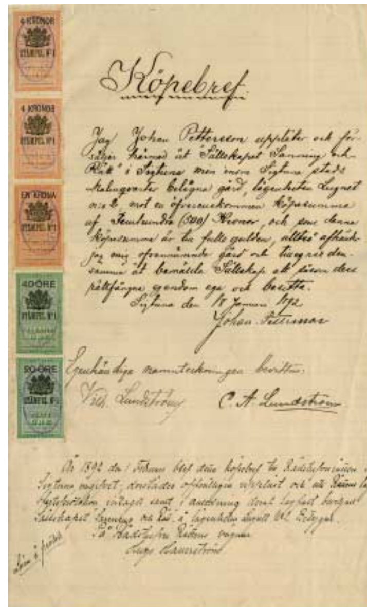
Köpbrevet bevittnat av ägarna till Lundströmska gården.