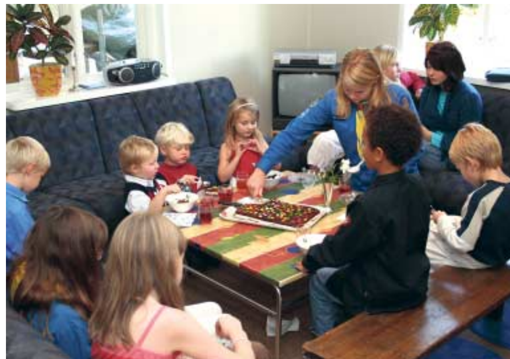
Kyrkkaffe för de yngsta.