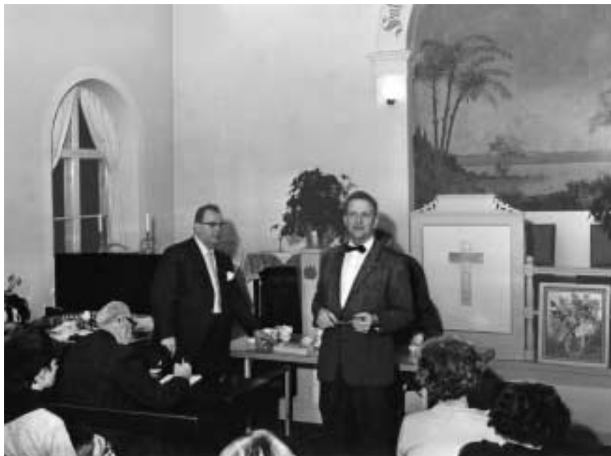
Auktion på inventarier från kapellet Klippan i Salem år 1965. Fondmålning från det heliga landet och predikstol (nu återanvänd som psalmbokshylla) dominerar interiören.

Salem renoveras och byggs till i flera omgångar, första gången år 1909 under ledning av församlingens organist, byggmästaren Gustaf Flöjt. 1909–1946 pryds