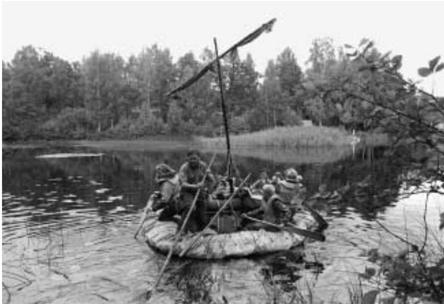
På riksläget Selo 1985 höll Skeppet i det populära projektet att bygga risflottar och det centrala matförrådet i form av en mycket uppskattad handelsbod.