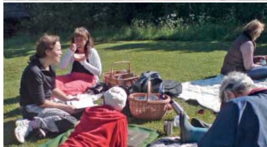
Scoutstugan i Viby är inte bara till glädje för scouterna. På julaftonens morgon används Stallet för ett ärligt julspel och på vårens förlägger många sina samlingar i Viby, här är det Kvinnofrukost i det gröna.