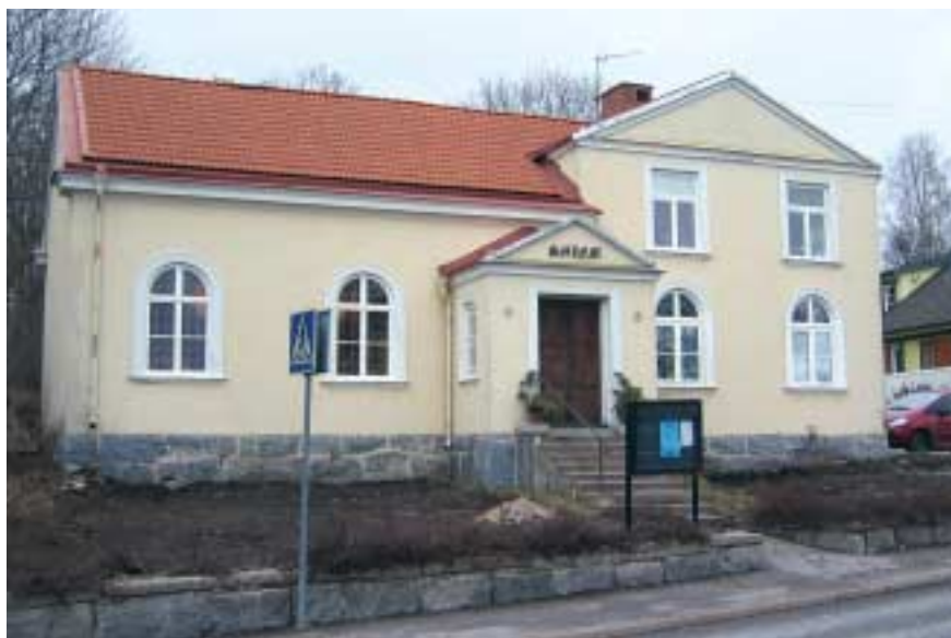
Salem 2002 före tillbyggnad.

Församlingen är som bäst en kropp där Kristus är huvudet och vi människor medlemmar. På samma sätt som vi själva är Guds kläder, höljet kring en gnista av Guds ande, är kyrkobyggnaden församlingens kläder, skalet kring församlingens gemensamma liv i högtid och vardag. Kyrkobyggnaden själv är inte helig av annat skäl än församlingens närvaro och gemenskap under Kristus, men den kan vara församlingens stolthet – och dess bekymmer. Att bygga och vårda den gemensamt är som att sy, lappa, tvätta och stryka sin rock eller kappa. Förr ärvde man också kläder, och även idag övertar barn kläder från sina storasyskon och kanske kamrater. Vår kyrka har vi ärvt av våra »storasyskon«, och vi har ett ansvar för att vårda byggnaden för våra småsystors räkning! När Sigtuna baptistförsamling började växa på nytt insåg vi snart att lokalerna skulle bli otillräckliga, men vi hade en del olika uppfattningar