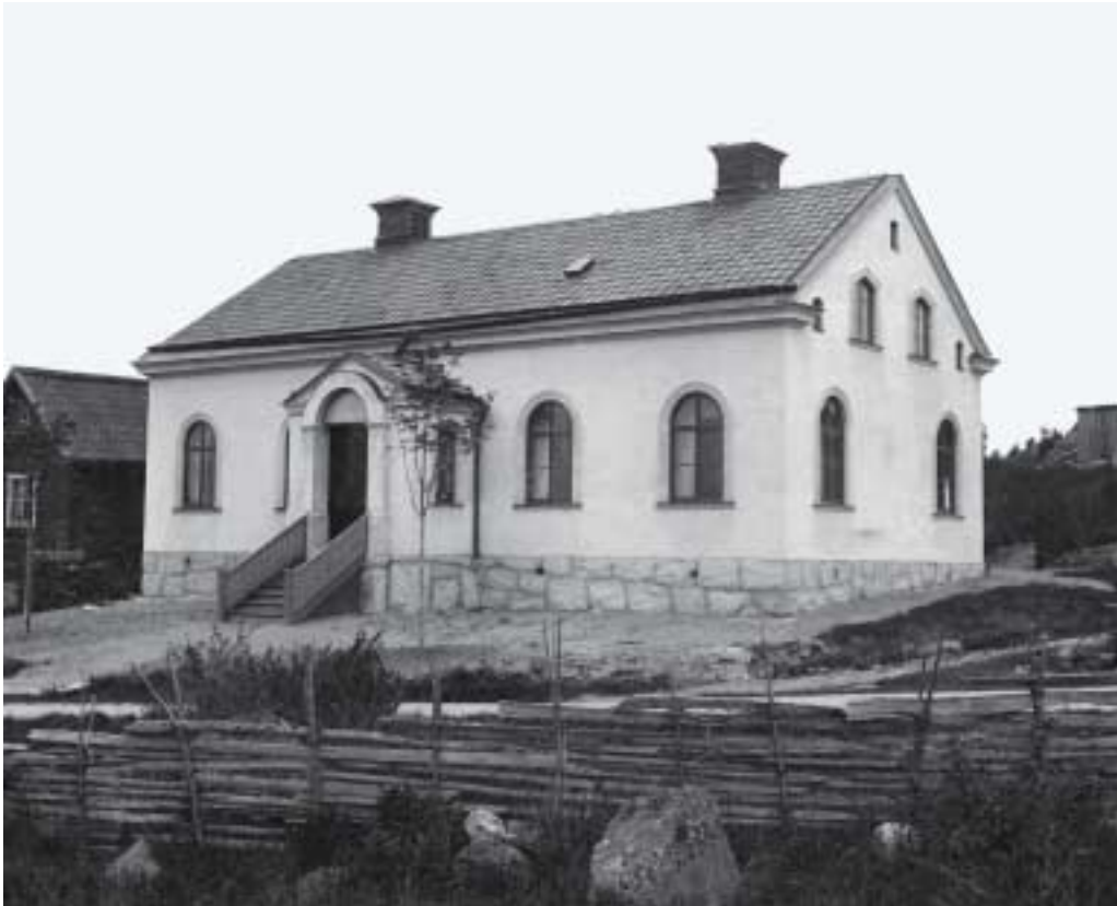
Salem i ursprungligt skick.

Det är i denna optimistiska tidsanda som man griper sig an uppgiften att bygga kapell, och man murar upp ett gediget tempel med tjocka väggar av tegel från Bärmö tegelbruk.